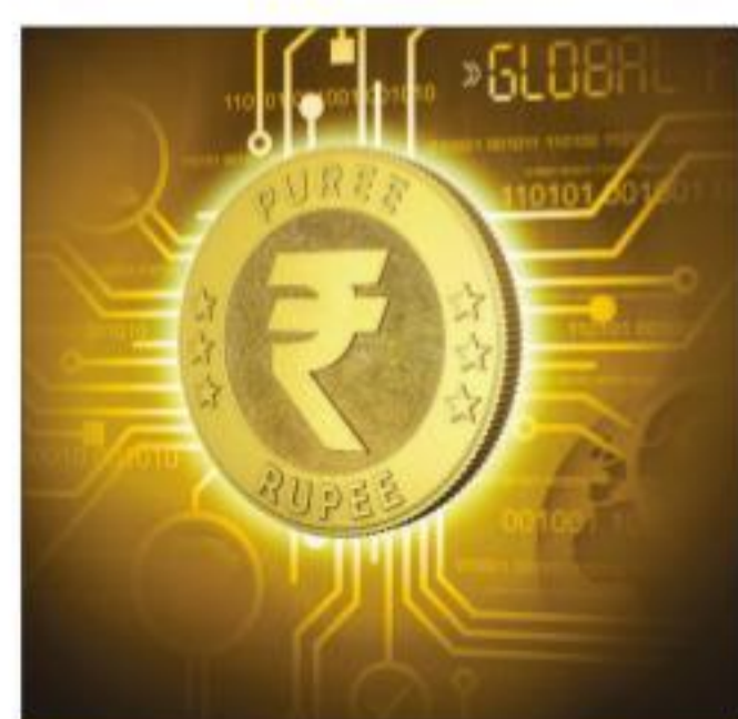
The decision on the awareness campaign was taken at a meeting convened by the Department of Financial Services on December 5

"Easing the flow of payment from certain (sanctions-hit or crisis-ridden) countries through the rupee trade is just one part of it. The bigger aim is to internationalise the rupee. So, any country can choose to implement it. That's why developing a credible system is very impor-